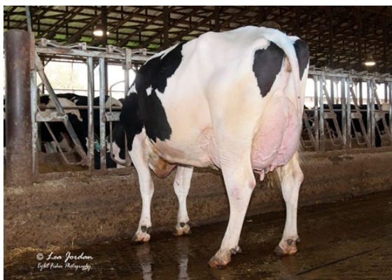
OCD DELTA 33343 FIFTH DAM