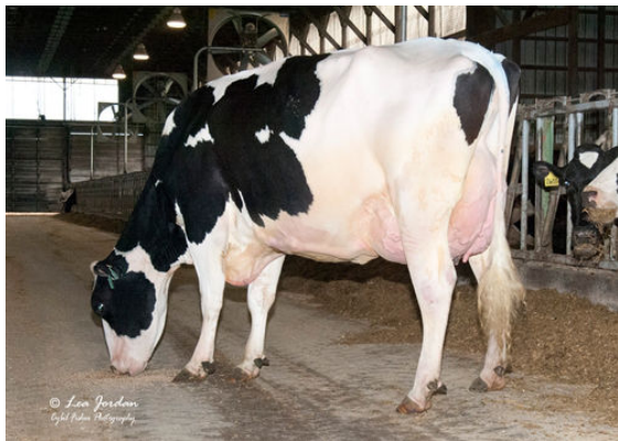
OCD DELTA 33343 FIFTH DAM